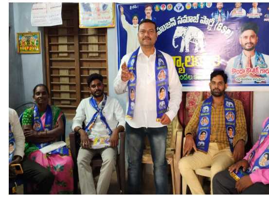
రాజకీయ అవకాశాలు కల్పిస్తుందని, అందుకు భద్రాచలం నియోజకవర్గంలో ఉన్న పద్మశాలీ సామాజిక వర్గ ప్రజలు పెద్ద ఎత్తున మద్దతు పలకాలని పిలుపునిచ్చారు. మండల