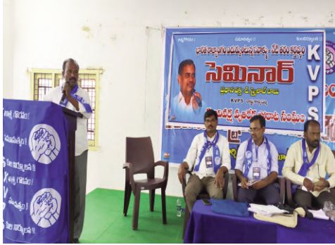
ఆశయాలను నిరుగుస్తున్నారని అన్నారు. దటీతులు మేదావులు అంబేద్కర్ వారులు ఐక్యంగా ఉండి పోరాడాలని ఆయన అన్నారు.