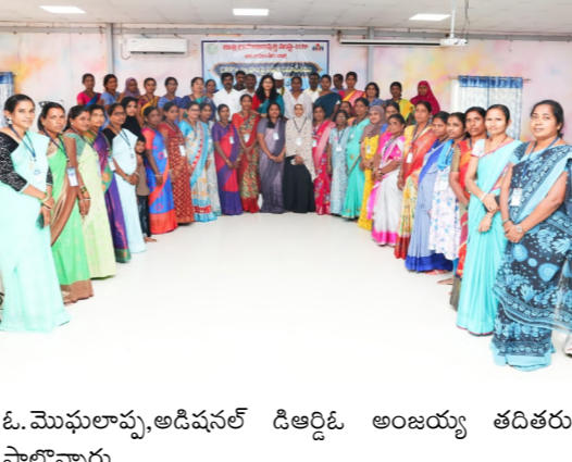
ఓ. మొఘలాపూ, అడిషనల్ డిఆఫిఓ అంజయ్య తదితరులు పాల్గొన్నారు.

ఉంటుందని క్యాంపెయిన్ ప్రకారం నడుచుకోవాలన్నారు. కర్ణాటక శివారు గ్రామాలైన గురజాలలో భాషా సమస్య ఉందని సంఘాలు బాగా నడిపిన రికార్డులు రాయలేని పరిస్థితిలో ఉంటారని సిఆర్పిలు కలెక్టర్ కు తెలిపారు. సిఆర్పిలు బుక్ కీవర్డు తెలుగులో రాయించడానికి తగిన తర్ఫీదు ఇవ్వాలన్నారు. పొదుపు చేస్తారు కానీ రాయడం వాదని వారికి తెలుగు పట్ల అవగాహన కల్పించాల్సిన బాధ్యత సిఆర్పిలపై ఉందని కలెక్టర్ తెలిపారు. ఎల్లవల్లి గ్రామ సంఘంలో ఒక రూపాయి కూడా లేదని అట్టి వాటిపై పరిశీలించాలన్నారు. మరో సిఆర్పి బాబమ్మ మాట్లాడుతూ భాష సమస్య ఉందనీ అట్టి సమస్యను అధిగమిస్తామని తెలిపారు. ఇంకా అనేక సమస్యలపై సిఆర్పిలు వారి సమస్యలు వివరించారు. ఈ సమావేశంలో డి. ఆర్. డి.