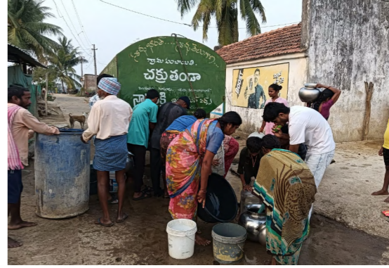
భగీరథ నీటి సరఫరాలో చిన్న సమస్య తలెత్తితే చాలా రోజుల తరబడి నీటి సరఫరా నిలిచిపోతోంది. దీంతో ప్రజలు తీవ్ర ఇబ్బందులు పడుతున్నారు. వేసవి ప్రారంభంలోనే సమస్య తీవ్రంగా ఉంటే ముస్సంధు పరిస్థితి ఏంటని ప్రజలు వాపోతున్నారు. ఇప్పటికైనా అధికారులు తాగునీటి సరఫరా కోసం ప్రత్యామ్నాయ ఏర్పాటు చేయాలని కోరుతున్నారు. తండాకు నల్లల బావి నుంచి పైపులైన్ ను పునరుద్ధరించి మిషన్ భగీరథ పైపులైన్ కు లింక్ చేస్తే భగీరథ నీళ్లు సరఫరా కానున్నందు వినియోగించుకోవచ్చని అభిప్రాయపడుతున్నారు.

బండ్ అవుతున్నది. తండాకు సరఫరా అయ్యే పైపులైన్ గేట్ వాల్ వద్ద చిన్నపాటి సమస్య తలెత్తగా వెంటనే మరమ్మతు చేయకపోవడంతో మూడ్రోజులుగా నీటి సరఫరా నిలిచిపోయింది. గ్రామపంచాయతీ సిబ్బంది ఉన్నతాధికారులకు విషయం తెలిపినా కూడా సమస్య పరిష్కారం కాలేదు. దీంతో చేసినేమి లేక గురువారం సాయంత్రం గ్రామపంచాయతీ సిబ్బంది ట్యాంకర్ ద్వారా నీటిని సరఫరా చేశారు. కానీ అది కూడా తాత్కాలిక ఉపశమనమే. 500కు పై బడిన జనాభాకు, వందలాది సంఖ్యలో ఉన్న జీవాలకు ఏ మూలన నిలిపోనీ పరిస్థితి. నిరుపయోగంగా మిషన్ భగీరథ ట్యాంక్.. ప్రతి ఇంటికీ తాగునీరందంచడమే లక్ష్యంగా ప్రభుత్వం ప్రతి ఇంటికీ నల్లతో పాటు గ్రామానికి ఒక మిషన్ భగీరథ ట్యాంక్ ఏర్పాటు చేసింది. అయితే చక్కతండాలో రూ.లక్షలు వెచ్చించి నిర్మించిన భగీరథ నీళ్ల ట్యాంక్ ప్రారంభించకుండానే నిరుపయోగంగా మారింది. అధికారులు భగీరథ ట్యాంక్కు నిర్మించారే కానీ.. దానికి పైపులైన్ వేయడం మరిచారు.. దీంతో ప్రస్తుతం ఆ ట్యాంక్ నిరుపయోగంగా మారింది. ట్యాంక్కు పైపులైన్ కనెక్షన్ ఇస్తే కొంత వరకైనా నీటి ఎద్దడిని నివారించొచ్చని తండావాసులు భావిస్తున్నారు. ప్రత్యామ్నాయ ఏర్పాటు తప్పనిసరి.. మిషన్