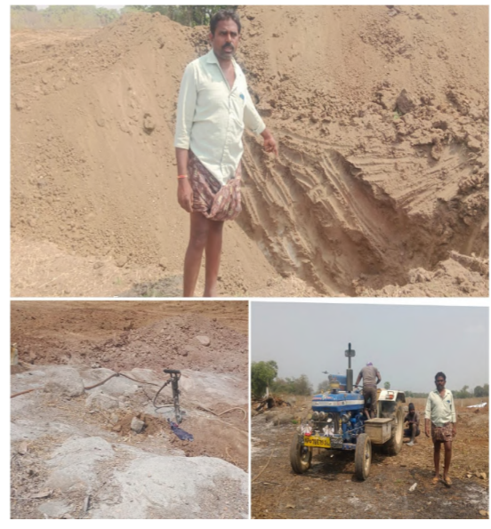
నోటికీ వచ్చినట్లు తిరుతూ ఎక్కువ మాట్లాడితే చంపేస్తామని బెదిరిస్తూ మా పై దాడికి ప్రయత్నిస్తూ నా భూమిని కట్టా

తొర్రూరు ఫిబ్రవరి 27(నిజం చెప్పతాం)రియల్టర్లతో నా తమ్ముడు కుమ్మక్కే కోర్టు నుండి నాకు ఇంజక్షన్ ఆర్డర్ వచ్చినా కూడా 2019 నుండి నా పేరు పై పట్టా పాస్పూక్ ఉన్నా కూడా అధికారులు రియల్టర్ల అండదండలతో నన్ను భయభ్రాంతులకు గురిచేస్తూ నేను లేని సమయం చూసి రాత్రికి రాత్రీ డోజ్ కంప్రైస్ ఫ్రాక్ లైసెన్స్ తో పనులు వేగవంతం చేసి నాకు పట్టా ఉన్న భూమిలో లోకైన్ బొందలు తీస్తూ బండలు పగలగొట్టి ఆ కందకాలలో చేసి పూడుస్తూ భూమిని కట్టా చేసి యోచనలో ఉండగా నేను నా కుటుంబ సభ్యులు వెళ్లి ప్రశ్నించగా ఏం చేసుకుంటావో చేసుకోకుంటూ మమ్మలను