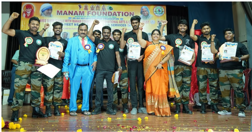
వేతలు,ప్రముఖులు అభినందిస్తూ ఇలాంటి కార్యక్రమాలను ఇంకెన్నో నిర్వహించాలి అని సూచిస్తూ ఘనంగా సత్కరించారు.