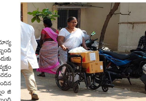
పరిస్థితి నెలకుందిన వారు చెబుతున్నారు. సమస్యలు చక్కదిద్దాలని విజ్ఞప్తి చేస్తున్నారు.

కాకినాడ, ఫిబ్రవరి 22 (నిజం ప్రతినిధి) ప్రభుత్వ సామాన్య ఆసుపత్రిలో వార్డులోని సామాగ్రిని తరలించేందుకు సిబ్బంది వీల్ ఛైర్లను వినియోగిస్తున్నారు. రోగులను తరలించేందుకు సరిపడా వీల్ ఛైర్లు లేకపోవడంపై పలువురు అసహనం వ్యక్తం చేస్తున్నారు. అలాంటిది అందులో సామాగ్రి తరలించడం ఏంటని ప్రశ్నిస్తున్నారు. జగ్గంపేట పరిధి ముల్లి సాలకు చెందిన ఒక రోగి కాళ్ళు చేతులు పనిచేయక శనివారం మధ్యాహ్నం జి జి హెచ్ అత్యవసర విభాగానికి వచ్చారు. ఆసుపత్రి సిబ్బంది అందుబాటులో లేకపోవడంతో రోగి బంధువులే స్ట్రక్చర్ పై వార్డుకు తరలించారు. సిబ్బంది కొరత కారణంగానే ఈ పరిస్థితి నెలకుందిన వారు చెబుతున్నారు. సమస్యలు చక్కదిద్దాలని విజ్ఞప్తి చేస్తున్నారు.