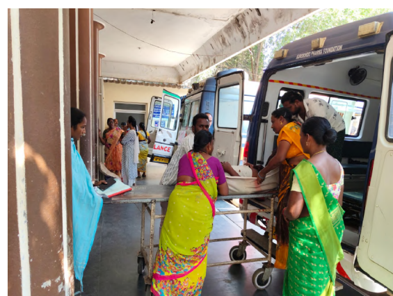
పరిస్థితి నెలకుందిన వారు చెబుతున్నారు. సమస్యలు చక్కదిద్దాలని విజ్ఞప్తి చేస్తున్నారు.