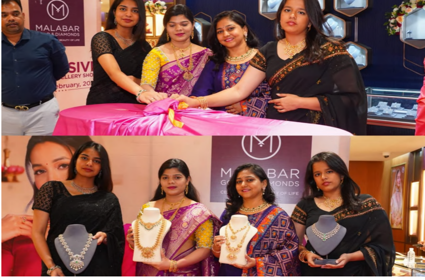
అనుగుణంగా 28-పాయింట్ల నాణ్యత పరీక్షలు నిర్వహించిన బజిబ మరియు జిబిఎ దృవీకరించిన వజ్రాభరణాలు,బైబ్యాక్ గ్యారెంటీ,నాణ్యతను తనిఖీ చేయడానికి క్యారెట్ ఎనలైజర్,జీవితకాల నిర్వహణ మరియు బాధ్యతాయుతమైన మూలాల నుండి బంగారం సేకరణ వంటి వాగ్దానాలను అందిస్తుంది.

ఫిబ్రవరి 07 నుండి ఫిబ్రవరి 11 వరకు కేర్లంగంపల్లి,ఫిబ్రవరి 07(నిజం న్యూస్):- మలబార్ గోల్డ్ అండ్ డైమండ్స్ చందానగర్ షోరూంలో ప్రవేశపెడుతుంది అద్వితీయమైన బ్రాండెడ్ ఆభరణాల ప్రదర్శన.ఈ ప్రదర్శనలో భాగంగా బంగారం,వజ్రాభరణాలు మరియు జాతి రత్నాభరణాలను ప్రదర్శిస్తుంది.ఈ ఆభరణాలు అద్వితీయమైన కళానైపుణ్యంతో,అంతలేని హుందాతనంతో కూడినవి.నగిషీ చెక్కిన ప్రతీ ఆభరణం తయారు చేసిన వారి అనుభవం ఇంకా కళాత్మకతకి నిదర్శనంగా నిలుస్తోంది.ఈ అద్వితీయమైన బ్రాండెడ్ ఆభరణాల ప్రదర్శనని ముఖ్య అతిథులు మలబార్ కస్తూర్,మలబార్ గోల్డ్ %౧౦% డైమండ్స్ టీం మెంబర్స్,ఉన్నత అధికారులు మరియు శ్రీయోధిలాపుల సమక్షంలో ప్రారంభించారు.అద్వితీయమైన బ్రాండెడ్ ఆభరణాల ప్రదర్శనలో ప్రత్యేక ఆకర్షణలుగా మలబార్ గోల్డ్ %౧౦% డైమండ్స్ వారి బ్రాండుల సమాహారం మైనీ ద్రువీకరించబడిన వజ్రాభరణాలు,వివాహ మరియు పార్టీ సంబరాల కోసం,ఎరా అన్వల్ వజ్రాలతో పొడిగిన విశిష్ట శ్రీశీ,ప్రెవ్యు జాతిరత్నాభరణాల సముదాయం,ఎత్తిక్స్ హస్తకళా నైపుణ్యంతో తయారైన ఆభరణాలు,డివైన్ భారతీయ ప్రాచీన సంప్రదాయం వ్యక్తం చేసే ఆభరణాలు ఇంకా చిన్నారుల కోసం స్ట్రైట్ పిల్లల ఆభరణాలు సమకూర్చారు.ఈ ప్రదర్శన చందానగర్లో 07 ఫిబ్రవరి నుండి 11 ఫిబ్రవరి వరకు 2025, నిర్వహించబడుతుంది.మలబార్ గోల్డ్ %౧౦% డైమండ్స్ నిబద్ధతలో భాగంగా,తమ వినియోగదారులకు 11 న్యాయమైన వాగ్దానాలను అందిస్తుంది.ఖచ్చితమైన తయారీ ధర్,రాళ్ల బరువు, నికర బరువు మరియు ఆభరణాల రాళ్ల విలువతో కూడిన పారదర్శక ధరల పట్టి,ఆభరణాలకు జీవితకాల ఉచిత నిర్వహణ,పాత బంగారం ఆభరణాలను తిరిగి విక్రయించుటప్పుడు బంగారానికి 100 శాతం విలువ మరియు బంగారం మార్పిడిపై చూపు తగ్గింపు,సేబు శాతం బి.ఐ.ఎస్ (హెచ్ యు ఐ డి) హోల్ మార్కెట్ దృవీకరించబడిన స్వచ్ఛమైన బంగారం,అంతర్జాతీయ ప్రమాణాలకు