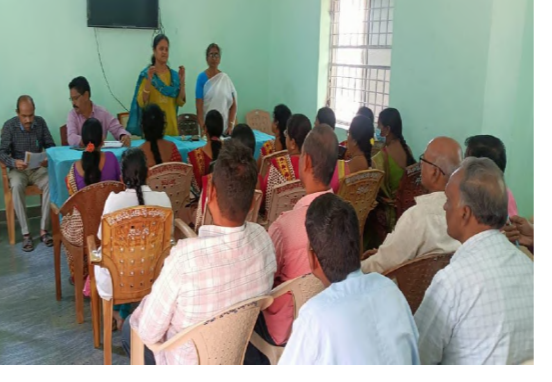
2సంవత్సరాల పిల్లలకు సగం మాత్ర,2నుండి 19సంవత్సరాల పిల్లలకు ఒక అద్దాండ్ జోల్ 400 మిల్లీ గ్రామ్ మాత్ర అన్ని ప్రభుత్వ మరియు ప్రైవేట్ పాఠశాలలో అంగన్వాడీ కేంద్రంలో ఈ మాత్రలు పంపిణీ చేయడం జరుగుతుందని తెలిపారు.వ్యక్తి గత, పరిసరాల పరిశుభ్రత

నేరేడుచర్ల ఫిబ్రవరి, 7 (నిజం చెప్పాం న్యూస్):ఫిబ్రవరి 10వ తేదీన నిర్వహించే జాతీయ నులి పురుగులు నివారణ కార్యక్రమం” గురించి ప్రాథమిక ఆరోగ్య కేంద్రం నేరేడుచర్ల యందు అవగాహన కార్యక్రమం నిర్వహించడం జరిగింది ఈ కార్యక్రమంలో వైద్య అధికారి నాగిని మాట్లాడారు ప్రభుత్వ ప్రైవేటు పాఠశాల ఉపాధ్యాయులకు, అంగన్వాడీ టీచర్లకు, శిక్షణా కార్యక్రమం నిర్వహించడం జరిగింది. 1నుండి 19 సంవత్సరాల పిల్లలలో ఎక్కువగా హఠాత్తు జీవి ద్వారా సంక్రమించే నులి పురుగులు, కోకి పురుగులు, ఏలిక పాములు ప్రేగుల లో చేరి పిల్లల లో రక్త హీనత,పోకాలు లోపం, ఆకలి లేకపోవడం, కడుపు నొప్పి,వికారం, బలహీనత, బరువు తగ్గడం%శీ% వంటి లక్షణాలు కనబడతాయి. నులి పురుగులు సంక్రమించకుండా భోజనానికి ముందు,టాయిలెట్ ఉపయోగించిన తరువాత ప్రతి సారి చేతులు శుభ్రముగా కడుక్కోవాలి.నులి పురుగులు: నివారణ, కోరకు 1నుండి