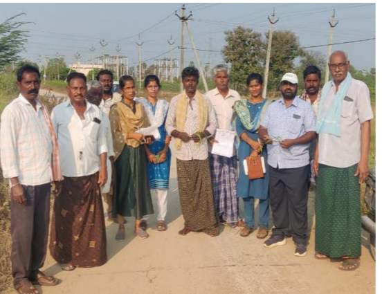
పెంచికల్ దిన్న గ్రామంలోవరి పొలాలను ముందు గా ఈనుతున్న వాటిని పరిశీలించడం జరిగినది రైతులతో కూడా ఇప్పటివరకు ఏ. ఏ .పద్మతులు వరి సాగు చేశారో అన్ని వివరాలు రైతుల దగ్గర నుంచి సమైక్యం చేసుకోవడం జరిగినది. కంప సాగర్ వ్యవసాయ శాస్త్రవేత్తల బృందం వారిపై 40 రోజుల్లో ఈనెల వరి పేర్లు కారణమైన వివరాలను సూర్యాపేట జిల్లా కలెక్టర్ కి నివేదిక సబ్మిట్ చేస్తారని వ్యవసాయ