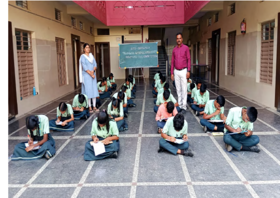
కాన్ఫ్ వారికి ప్రత్యేక కృతజ్ఞతలు తెలియజేశారు. ఈ కార్యక్రమంలో విద్యార్థిని విద్యార్థులు మరియు ఉపాధ్యాయులు పాల్గొన్నారు.

కారకాలను తొలగిస్తాయని, జీవ వైవిధ్యానికి నిలయాలని అనేక జీవహాతులకు ఆవాసాలుగా ఉంటాయని మరియు చేపల పెంపకానికి అనువైనవి చిత్తడి నేలలని ఈ సందర్భంగా తెలియజేశారు. అటువంటి చిత్తడి నేలలు పరిరక్షించుకోవడానికి నీటిని పుష్కరం చేయకుండా, కాలుష్యం తగ్గిస్తూ, ప్లాస్టిక్ వాడకాన్ని తగ్గించడం ద్వారా మనం రక్షించుకోవచ్చని తెలియజేశారు.చిత్తడి నేలలను పరిరక్షించుకోవడం వలన రాబోయే భవిష్యత్ తరాలవారికి ఎంతో ఉపయోగకరంగా ఉంటాయని కాబట్టి ప్రతి ఒక్కరు పర్యావరణ పరిరక్షణలో భాగంగా చిత్తడి నేలలను కాపాడుకుంటూ చెట్లను పెంచాలని ఈ సందర్భంగా సూచించారు. అలాగే ఈ వ్యాసరచన పోటీలలో అత్యుత్తమ ప్రదర్శన కనబరిచిన వారికి బహుమతి ప్రధానోత్సవం ఉంటుందని విద్యార్థులకు తెలియజేశారు. విద్యార్థులకు ఈ వ్యాసరచన పోటీలు నిర్వహించిన తెలంగాణ నేషనల్ గ్రీన్