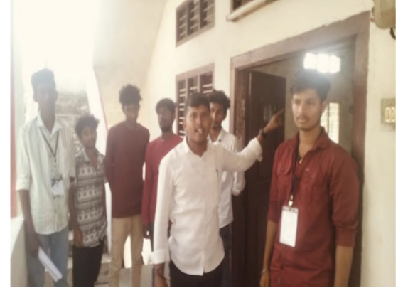
సూచించారు. గతంలో ఎన్నడు లేని విధంగా కాంగ్రెస్ సర్కార్

- విద్యార్థులకు వైద్య సేవలు చేసి తన వృత్తిని చాటుకున్న ఎమ్మెల్యే డా భూక్యా మురళి నాయక్ గూడూరు ప్రతినిధి ఫిబ్రవరి 07 నిజం చెబుతాం గూడూరు మండలంలోని దామరవన గిరిజన గురుకులంలో ఇద్దరు విద్యార్థులు అస్వస్థులకు గురికాగా వెంటనే గమనించిన సిబ్బంది హుటాహుటిన గూడూరు ప్రభుత్వ తరలించారు విషయం తెలుసుకున్న ఎమ్మెల్యే డా.భూక్యా మురళి నాయక్ విద్యార్థులను పరామర్శించారు.అంతేకాకుండా తానే స్వయంగా విద్యార్థులకు వైద్య పరీక్షలు చేసి తన వృత్తిని చాటుకున్నారు.అంతేకాకుండా విద్యార్థులకు మెరుగైన వైద్యం అందించాలని వైద్యులకు