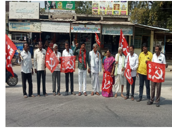
వ్యతిరేకంగా పనిచేస్తూ 20 శాతం ఉన్న పెట్టుబడిదారుల