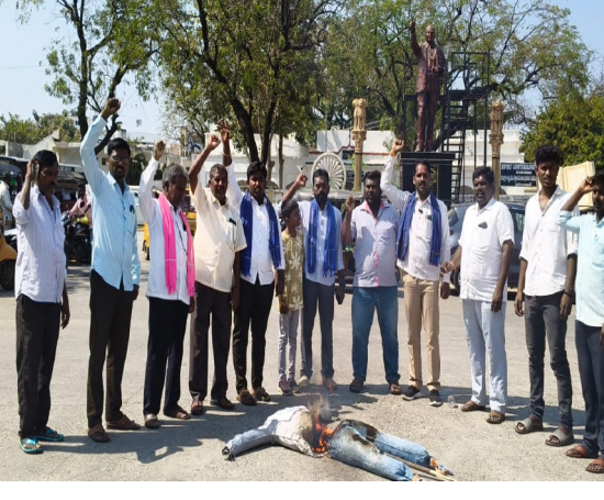
నాయకులు తదితరులు పాల్గొన్నారు.