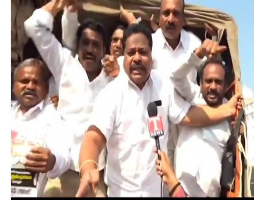
తమను కాంగ్రెస్ ప్రభుత్వం పోలీసులతో అక్రమంగా అరెస్టులు చేయించి తీవ్ర ఇబ్బందులకు గురి చేస్తుందని మండిపడ్డారు.

రాజాపేట, ఫిబ్రవరి 5 (నిజం చెప్పతాం) మాజీ సర్పంచ్ ల పెండింగ్ బిల్లులు చెల్లించాలని రాష్ట్ర తాజా మాజీ సర్పంచ్ ల ఫోరం ఆధ్వర్యంలో బుధవారం ఉరి తాళ్లతో సచివాలయం ముట్టడికి వెళ్లిన నాయకులను పోలీసులు అరెస్టు చేశారు. ఈ సందర్భంగా తాజా మాజీ సర్పంచ్ ల ఫోరం రాష్ట్ర ఉపాధ్యక్షుడు గుంటి మధుసూదన్ రెడ్డి మాట్లాడుతూ ప్రభుత్వమే ఏర్పడి 14 నెలలు గడుస్తున్న పెండింగ్ బిల్లులు ఇంతవరకు విడుదల చేయలేదని, అప్పులు తెచ్చి పనులు చేసిన మాకు ఆత్మహత్యలే శరణ్యమని, సచివాలయం ముట్టడికి వెళ్లిన