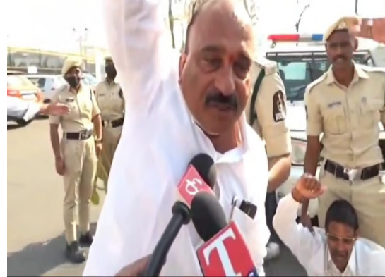
ప్రభుత్వం వెంటనే తమ పెండింగ్ బిల్లు విడుదల చేయాలని డిమాండ్ చేశారు. లేనివక్షంలో పంచాయితీ ఎన్నికలను అడ్డుకుంటామని హెచ్చరించారు.