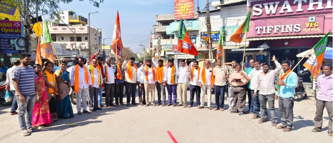
భారత్ బడ్జెట్ 2025 - 2026 లో వ్యవసాయ, కార్మిక, పారిశ్రామిక రంగాలతో పాటు విద్య, వైద్య, రియల్ ఎస్టేట్, బట్టి రంగాల్లోనూ సమూల మార్పులు చోటు చేసుకుంటున్నాయని పేద మధ్య తరగతి ప్రజలకు ఎంతో మేలు జరుగుతుందని భారతదేశం అభివృద్ధిలో మరింత ముందుకు తీసుకెళ్లేందుకు ఈ బడ్జెట్ ఉపయోగ పడుతుందని అన్నారు భారత్ ప్రధాని శ్రీ నరేంద్ర మోడీ గారికి ఆర్థిక మంత్రి నిర్మల సీతారామన్ కి ధన్యవాదాలు తెలిపారు. ఈకార్యక్రమంలో బిజిపి సీనియర్ నాయకులు పలుగుల