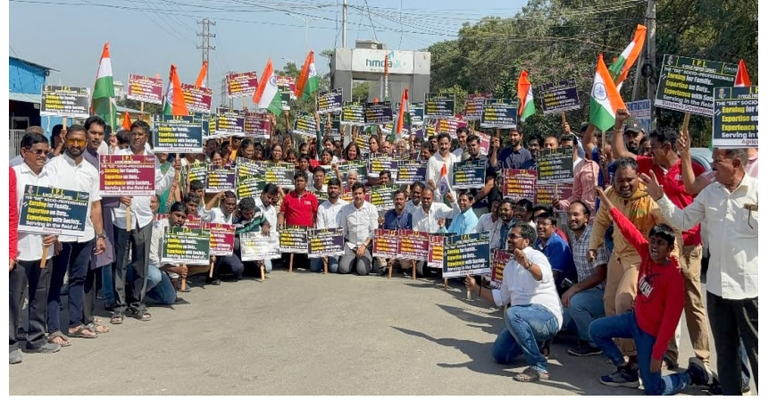
రివల్ చేస్తున్న సేవలను అభినందించారు ఈ తరం యువత చట్టాలను సహకారం చేయాలని దీక్షతో ముందుకు సాగుతున్న ఐ ఫోకస్ మిషన్ యువత భవిష్యత్తును తీర్చిదిద్దడంలో మరో అడుగు వేసింది ఒకరి విజయ మరొకరికి ఉద్యమం ఎంతో మందికి మార్గదర్శక నిలిచింది