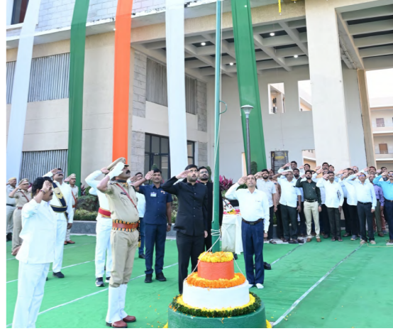
అధికారులు, ఇతర అధికారులు, ఉద్యోగులు, స్వాతంత్ర్య సమరయోధులు, కవులు, కళాకారులు, వివిధ పాఠశాల విద్యార్థులు, ప్రజలు పాల్గొన్నారు.