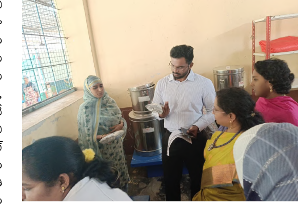
పరీక్షలు నిర్వహించాలని, ప్రతి విద్యార్థులను గమనిస్తూ ఉండాలని సూచించారు, ఈ కార్యక్రమంలో సంబంధిత వాల్టెస్ ప్రిన్సిపల్ తదితరులు అదనపు కలెక్టర్ వెంట ఉన్నారు.

లం, రాత్రి డిన్నర్ లను రుచికరంగా ఏర్పాటు చేయాలని సూచించారు, పంటలు సిద్ధం చేసి నిల్వించి పరిశుభ్రంగా ఉండాలని సూచించారు, నాణ్యమైన వదారాలతో ఆహారం సిద్ధం చేయాలని తెలిపారు, జిల్లాలోని ప్రత్యేక అధికారులు వారికి కేటాయించిన ప్రదేశాలలో అన్ని వసతి గృహాలను నిత్యం తనిఖీలు చేయాలని అదనపు కలెక్టర్ తెలిపారు, విద్యార్థిని, విద్యార్థులకు ప్రతి సభ్యులలో ప్రతిభ కనబరిచే విధంగా విద్యా బోధనలు అందించాలని సూచించారు, తెలంగాణ ప్రభుత్వం విద్యార్థులకు అందించే డైరీ మెనూ ప్రకారం రుచికరమైన వంటకం అందించడం జరుగుతుందని, పరిశుభ్రత పరిరక్షణ పాటించాలని, వసతి గృహాలు పాఠశాల వరసాలో సానిటేషన్ క్రమం తప్పకుండా నిర్వహించాలని, పాఠశాల, వసతి గృహాల హాస్టల్ వెళ్ళే అధికారులు, ప్రిన్సిపల్స్ క్రమం తప్పకుండా షెడ్యూల్ ప్రకారం పిల్లలకు ఆహారం అందించాలని, నిత్యం వైద్య