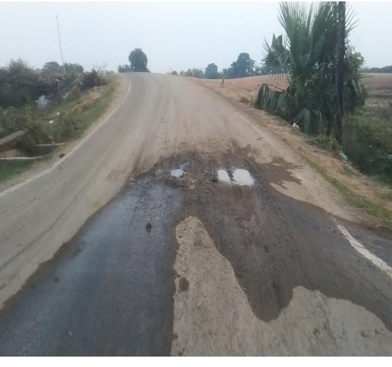
నిల్వించి తక్షణమే పరిష్కరించి వాహనాదులకు ప్రమాదాలను నివారించాలని గ్రామస్థులు కోరుతున్నారు.

ఏటూరునాగారం జనవరి 10 నిజం చెబుతాం న్యూస్ ములుగు జిల్లా బ్యారో: ఏటూరునాగారం మండలంలోని రామన్నగూడెం, రాంనగర్ మీదుగా కమలాపురం వరకు గడిచిన సంవత్సరం వేసవి కాలంలో వేసిన తారు, రామన్నగూడెం గ్రామ శివారులో ఏర్పాటు చేసిన మిషన్ భగీరథ వాటర్ ట్యాంక్ కి అమర్చిన మెయిన్ పైపు లీకేజీ తో కొన్ని నెలల నుండి నీరు లీకేజీతో అక్కడ రోడ్డు మీద పెద్ద గుంత పడి రాంనగర్ మీదుగా రామన్నగూడెం ప్రారంభంలో కరకట్ట మీదుగా రోడ్డు దిగి రావాలి అక్కడ పక్క గుంత అటు నుండి వచ్చే వాహనాల కు సరిగా కనపడదని అవుపు తప్పి గుంతలో పడితే దీనివల్ల వాహనాదులకు రోడ్డు ప్రమాదం జరిగే అవకాశం ఉంది ఈ విషయాన్ని గ్రామ పంచాయతీ