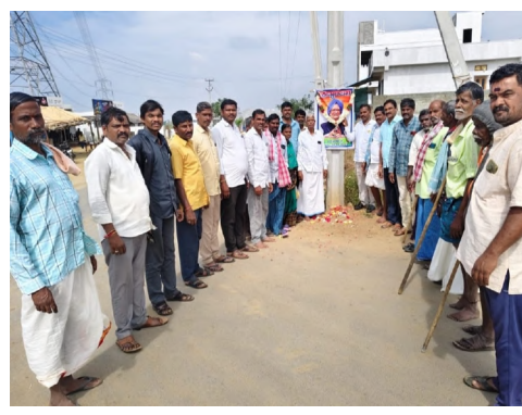
కాంగ్రెస్ పార్టీ కమిటీ తరుపున మన్మోహన్ సింగ్ కి ఘన నివాళి అర్పించారు