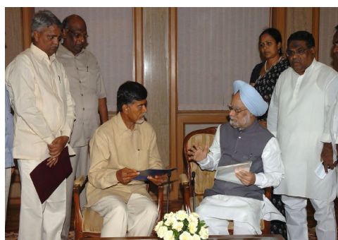
వేత్తను,పరిపాలన దక్కడిని దేశం కోల్పోయింది.వారి కుటుంబ సభ్యులకు నా ప్రగాఢ సానుభూతి తెలియజేస్తున్నాను.