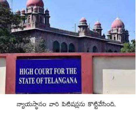
న్యాయస్థానం వారి పిటిషన్లను కొట్టివేసింది.

హైదరాబాద్, డిసెంబర్ 26, (నిజం చెపుతాం) గ్రూప్-1 పరీక్షలపై కొంతమంది అభ్యర్థులు చేసిన పిటిషన్లను తెలంగాణ హైకోర్టు కొట్టివేసింది. రిజర్వేషన్లతో పాటు పలు అంశాలపై అభ్యర్థులు హైకోర్టును ఆశ్రయించారు. రిజర్వేషన్ల అంశం తేలేవరకు గ్రూప్ 1 పరీక్ష ఫలితాలను ప్రకటించకుండా చూడాలని అభ్యర్థులు తమ పిటిషన్లలో కోరారు. ఈ మేరకు ఫలితాలు నిలిపివేసేలా ఆదేశాలు ఇవ్వాలని ఆ పిటిషన్లలో కోరారు. విచారించిన