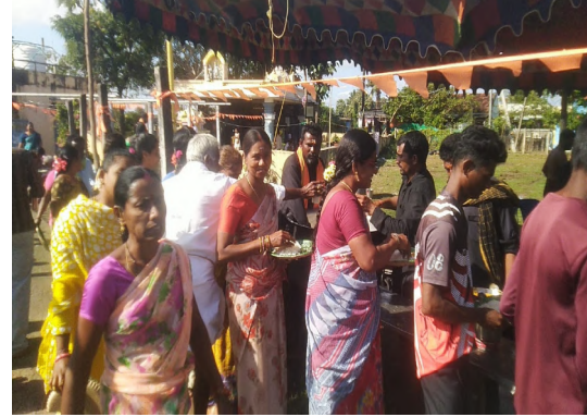
పాల్గొని ఇట్టి అన్నదానం కార్యక్రమాన్ని విజయవంతం చేశారు.