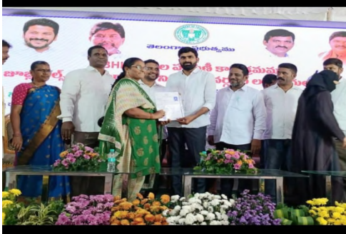
శాలువాతో సత్కరించి మద్దతు తెలిపినందుకు కృతజ్ఞతలు తెలిపారు ఈ కార్యక్రమంలో కమలా నగర్ వాసులు, రహమత్ నగర్ డివిజన్ కాంగ్రెస్ కార్యకర్తలు ఇతర ప్రముఖులు పాల్గొన్నారు.