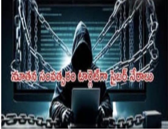
నూతన సంవత్సరం టురైటింగ్ సైబర్ నేరాలు