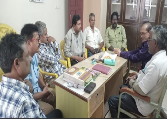
తీవ్రంగా ఖండించారు. అంజేద్ పట్ల అభిమానులను, ప్రజాస్వామిక