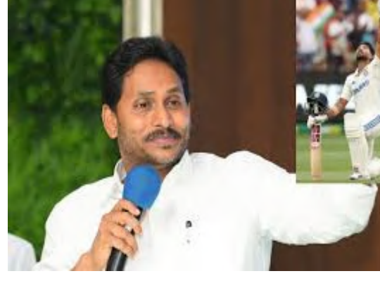
ఇకాంక్షిస్తున్నాను” అంటూ జగన్ తన సందేశంలో పేర్కొన్నారు.

అకట్టుకుంది. టెస్టులో తొలి సెంచరీ సాధించిన నితీశ్ రెడ్డిపై ప్రశంసల వర్షం కురుస్తోంది. తాజాగా, ఏపీ మాజీ ముఖ్యమంత్రి, వైసీపీ అధినేత జగన్ కూడా నితీశ్ సెంచరీపై స్పందించారు. “ఆస్ట్రేలియాతో బాక్సింగ్ డే టెస్టులో బ్రిలియంట్ సెంచరీ సాధించిన తెలుగబ్బాయి నితీశ్ కుమార్ రెడ్డికి శుభాభినందనలు. భారత జట్టు కప్పాల్లో ఉన్న వేళ, ఫాలో ఆన్ గండం పొంచి ఉన్న సమయంలో... జట్టు కోలుకోవడానికి తన వంతు కీలక పాత్ర పోషించారు. ఇలాంటివే మరెన్నో విరహ్యుణీయ ఇన్నింగ్స్ లు ఆడేందుకు ఈ సెంచరీనే నాంది అనుకుంటున్నాను. మైదానంలో నితీశ్ తన విజయప్రస్థానాన్ని ఇలాగే కొనసాగించాలని, మరింత ఖ్యాతిని అందుకోవాలని