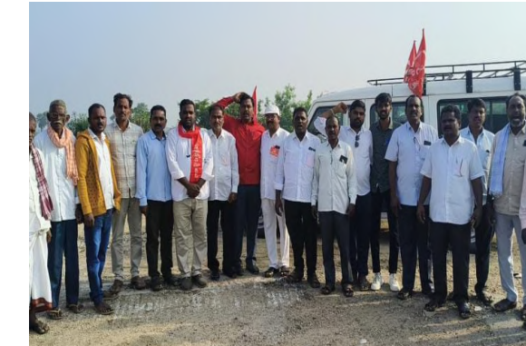
వెంచారు. ఇటువంటి పరిస్థితులలో దేశంలో ఉన్న విప్లవనీ

తిరుమలాయపాలెం డిసెంబర్ 28 నిజం చెబుతాం న్యూస్ ,,2013లో వివిధ కారణాల వలన విడిపోయిన న్యూడెమోక్రసీ లు నేడు విలీనం అవ్వాలనుకోవడం ఉత్సాహవంతమైన పరిణామం%శీ%అని ఈ విలీన సభను జయప్రదం కోరుతూ తిరుమలాయపాలెం మండలం పాలేరు డివిజన్ కమిటీ అధ్యక్షులు పెద్ద మొత్తంలో కార్యకర్తలు శ్రేణులు అయిలేదేరడం జరిగింది ఈ సందర్భంగా నీ డెమోక్రసీ జిల్లా కార్యదర్శి మాట్లాడుతూ భూమి కోసం ఘోషి కోసం పేద ప్రజల విముక్తి కోసం అర్ధవలన అర్ధ భూస్వామి వ్యవస్థ కి వ్యతిరేకంగా పోరాటం చేయాలనిదేశంలో మతోన్మాద బిజెపి మోడీ ప్రభుత్వం ఫాసిస్టు విధానాలతో ప్రజలను అరిగిన పెడుతున్నారని, సామ్రాజ్యవాద కంపెనీలకు దేశ సంపదను కట్టబెడుతున్నారని, మతం పేరుతో చిన్న పెట్టి మనుషుల మధ్య వైశామ్యాలు సృష్టిస్తు నరహత్యలకు పానం కోసం సాగిస్తున్నారని విమర్శించారు. రవయితలను, మేధావులను, కళాకారులను, హక్కుల నేతలను నక్సలైట్లంటూ అక్రమ కేసులు బనాయించి చిత్తహింసలు పెట్టి జైల్లో నిర్బంధిస్తున్నారని ఆవేదన