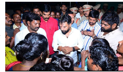
చర్యలు చేపట్టాలని ఆదేశించామన్నారు. గ్రామంలో శాంతి, సామర్యం పునరుద్ధించేందుకు కృషి చేస్తామన్నారు. ప్రజలు ఇక్కడవర్తకు తమ జీవనం సాగించాలి కోరారు. కూటమి ప్రభుత్వ చర్యలతో పాపంజులకు ఫుటనకు తావులేదని మంత్రి సుభాష్ చెప్పారు. చట్టాన్ని అటవీలించిన వారిపై చర్యలు తప్పవు అన్నారు. మంత్రి సుభాష్ వెంట కూటమి నాయకులు, పోలీస్ అధికారులు ఉన్నారు.