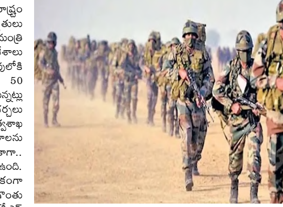
చౌరబడి ఫర్వల్, వాహనాలు, ఇతర సామగ్రిని తగలబెట్టారు. ఈ పరిస్థితులపై కేంద్రమంత్రి అమిత్ షా సమీక్ష నిర్వహిస్తున్నారు. ఈ పరిస్థితిని అదుపులోకి తీసుకొచ్చి, శాంతి స్థాపనకు తీవ్రంగా యత్నిస్తున్నారు. ఈ క్రమంలోనే మణిపుర్ కు బలగాలును తరలించేందుకు కేంద్రం సిద్ధమవుతున్నట్లు తెలుస్తోంది.

ఇంఫాల్,నవంబర్18,(నిజం చెప్పతాం): ఈశాన్య రాష్ట్రం మణిపుర్ లో కొంతకాలంగా హింసాత్మక పరిస్థితులు నెలకొన్నాయి. తాజా పరిస్థితులపై కేంద్ర హెరాంతాప మంత్రి అమిత్ షా ఉన్నత స్థాయి సమావేశాలు నిర్వహిస్తున్నారు.రాష్ట్రంలో శాంతిభద్రతలు అదుపులోకి తెచ్చేందుకు ప్రయత్నాలు జరుగుతున్నాయి.త్వరలో 50 కంపెనీల బలగాలును కేంద్రం మణిపుర్ కు తరలించనున్నట్లు తెలుస్తోంది. అందుకు మంత్రిత్వ శాఖలో చర్చలు జరుగుతున్నట్లు సమాచారం. అంతేకాకుండా.. మంత్రిత్వశాఖ బృందం త్వరలో రాష్ట్రంలోని కీలక ప్రాంతాలను సందర్శించనున్నట్లు సంబంధిత వర్గాలు వెల్లడించాయి. కాగా.. మణిపుర్ లో జాతుల మధ్య వైరం కొనసాగుతూనే ఉంది. ఇటీవల నెలకొన్న పరిస్థితులు హింసాత్మకంగా మారాయి"కోల్ కతా ఫుటన్.. నిందితుడి గొంతు వినిపించకుండా పోలీసుల హత్య..! "ఇటీవల సీఆర్ డీఎస్ ఎస్ కొంటార్ లో 10 మంది మృతి చెందడం, ఈ క్రమంలోనే మృత్యు తెగకు చెందిన ఆరుగురు ప్రాణాలు కోల్పోవడంతో ఉద్రిక్తతలు తీవ్రరూపం దాల్చాయి. రాష్ట్ర సిఎం బీరేన్ సింగ్ తో పాటు ముగ్గురు మంత్రులు, ఆరుగురు ఎమ్మెల్యేలు నివాసాలపై ఆందోళనకారులు దాడికి పాల్పడిన సంగతి తెలిసింది. ఇళ్లల్లోకి