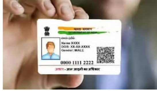
మార్చుకోవాల్సి ఉంటుంది. అందువల్ల ఎన్నిసార్లునా మార్చుకోవడానికి యు ఐ డి ఏ బి అవకాశం కల్పించింది.

తప్పులేంటంటే.. పుట్టిన తేదీ, పేరు, ఫోన్ నెంబర్, చిరునామా. ఇలాంటివి తప్పులుంటే అప్డేట్ చేయవచ్చు. మై ఆధార్ పోర్టల్ ద్వారా అన్ లైన్ లోనే ఆధార్ అప్డేట్ చేసుకోవచ్చు. ప్రస్తుతం ఉచితంగానే అప్డేట్ చేసుకోవడానికి కేంద్ర ప్రభుత్వం అవకాశం ఇచ్చింది. మీ దగ్గరలోని మీ పాస్ కేంద్రంలో ఆధార్ అప్డేట్ చేస్తారు. లేదా అన్ని బ్యాంకుల్లోనూ ఆధార్ అప్డేట్ కి ప్రత్యేక కౌంటర్లు ఉంటాయి. ముఖ్యంగా ప్రభుత్వ బ్యాంకుల్లో వీటిని ఎప్పుడూ నిర్వహిస్తారు. ప్రైవేటు బ్యాంకుల్లో ప్రత్యేక సందర్భాల్లో వీటిని విరాలు చేస్తారు. ఆధార్ కార్డులో చాలా మార్పులు చేయవచ్చు. కానీ కొన్ని లిమిట్లు ఉంటాయి. పేరు మార్చడానికి రెండు సార్లు అవకాశం ఇస్తారు. ఒకవేళ మీరు మూడో సారి కూడా పేరు మార్చుకోవాలనుకుంటే యు ఐ డి ఏ బి అనుమతి తీసుకోవాలి. పేరు ఎందుకు మార్చున్నారో దానికి సంబంధించిన ఆధారాలు చూపించాలి.అద్రన్ మార్చుకోవడానికి ఎలాంటి పరిమితి లేదు. ఉద్యోగులకు ట్రాన్స్ఫర్ ఉంటాయి కనుక తరచూ చిరునామా