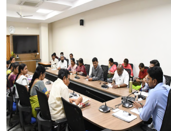
సమయమని ఈ సమయాన్ని ఇప్పటి నుంచే సర్వీస్ యోగం చేసుకోవాలని సూచించారు. అదనపు కలెక్టర్ లోకల్ బాడీస్ సంచీత్ గంగూర్, డి. ఈ. జి. గోవింద రాజులు, జి. సి. డి. జి. తుభలక్ష్మి, కే. జి. బి. వి. ల సైబల్ ఆఫీసర్లు, ప్రిన్సిపాల్ లు, తదితరులు పాల్గొన్నారు.

మంది విద్యార్థులు ఏ సబ్జెక్టులో ఫెయిల్ అయ్యారు అందుకు గల కారణాలు ఎందుకై, ఇప్పుడు ఏ విద్యార్థి ఏ సబ్జెక్టు లో వెనుకబడి అన్నాడో తెలుసుకొని వెనుకబడిన విద్యార్థులకు డిసెంబర్ 1 నుంచే ప్రత్యేక తరగతి నిర్వహించాలని సైబల్ ఆగ్రహం అడిగారు. ఈ సారి ఒక్క విద్యార్థి ఫెయిల్ కాకుండా చూసుకోవాలని, అదేసమయంలో చదువుకు ఉన్న విద్యార్థులను గుర్తించి వారిని మరియు ప్రోత్సహించాలని సూచించారు. చదువైన విద్యార్థులు జాబితా తయారు చేయాలని వారిని ఐ. ఐ. టి., ఎస్. ఐ. టి., ఉస్మానియా మెడికల్ క్యాంపస్ లను సందర్శించి స్కూల్ పొందేందుకు కార్యాచరణ చేపట్టాలని జిల్లా విద్యా శాఖ అధికారి అడిగారు. ప్రభుత్వ విద్యాలయాల్లో చదివిన వసపర్తి విద్యార్థులు ఐ. ఐ. టి., ఎస్. ఐ. టి., ఉస్మానియా మెడికల్ క్యాంపస్ లో సీటు పొందే విధంగా సన్నద్ధం చేయాలని సూచించారు. దీనికరకు జిల్లా యంత్రాంగం నుండి ఎలాంటి సహకారం కావాలన్న అందించడానికి సిద్ధంగా ఉన్నట్లు తెలిపారు. విద్యార్థులలో స్కూల్ నింపడానికి డాక్టర్లు, అడిషనల్ కలెక్టర్, శాసన సభల వచ్చి విద్యార్థులతో మాట్లాడి స్కూల్ నింపేందుకు ప్రతి శుక్రవారం ఒక గంట సమయం శేషం ఏర్పాటు చేయాలని సూచించారు. వార్షిక పరీక్షలు మార్చిలో ఉంటాయని అంతరం ఏప్రిల్ నుండి వివిధ కళాశాలల్లో చెరికకు పోటీ పరీక్షలు ఉంటాయి కాబట్టి ఇప్పుడు చాలా విలువైన