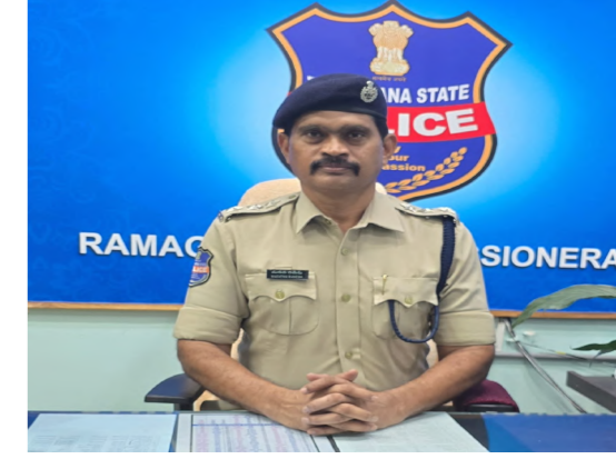
ఎగ్జామ్ హాల్ లో అయిన తర్వాత ఒంటిగంట వరకు ఎవ్వరిని బయటకు పంపడం జరగదని, అభ్యర్థులు ఎగ్జామ్ రూమ్ తర్వాత ప్రత్యేక ప్రాంతం తమతో పాటు, తీసుకువెళ్ళడానికి వీలుగా ఉంటుంది అన్నారు. అభ్యర్థులు ఎవరైనా మాల ప్రాక్టీస్, మాస్ కాపీంగ్ చేసినట్లు తెలితే చట్టరీత్య కఠిన చర్యలు తీసుకోవడం జరుగుతుంది అన్నారు.

ర్యాలీలు లాంటివి నిర్వహించ కూడదని, అవసరంగా గుంపులు గుంపులుగా ఎవ్వరూ కూడా పరీక్ష కేంద్రం పనిరంలాలో తిరగడానికి అనుమతి లేదన్నారు. పరీక్షా కేంద్రం పనిరం ప్రాంతాల్లో ఎలాంటి జిరాక్స్ షాపులు తెరిచి ఉంచరాదని షాపు యజమానులకు సూచించారు. అభ్యర్థులకు సూచనలు: - పరీక్ష రోజున అభ్యర్థులు ఉదయం 8:30 గంటల నుండి, ఉదయం సెషన్కు మరియు మధ్యాహ్నం 1:30 నుండి మధ్యాహ్నం సెషన్కు పరీక్షా కేంద్రాల్లోకి ప్రవేశించడానికి అనుమతించబడతారని, పరీక్ష మొదలు మరియు తర్వాత ఒక నిమిషం అలస్యంగా వచ్చిన ఎవ్వరిని లోపలికి అనుమతించడం జరగదు. ఎగ్జామ్ కు వచ్చిన అభ్యర్థులు హోల్ డిజిట్ నందున్న నియమబద్ధనాలు తప్పకుండా పాటించాలన్నారు. అభ్యర్థులు హోల్ డిజిట్ తో పాటు, ఒక కలర్ ఫోటో, ఓరిజినల్ ఆధార్ కార్డు/ డ్రెవింగ్ లైసెన్స్/ఉద్యోగ గుర్తింపు కార్డ్/ఓటర్ గుర్తింపు కార్డ్ ఏదైనా ఒకటి తప్పనిసరిగా తీసుకొని రావాలి ఉంటుందని అన్నారు. అభ్యర్థులు తమకు కేటాయించిన పరీక్ష కేంద్రాన్ని ముందస్తుగా చూచుకుంటే, పరీక్ష రోజు పరీక్ష కేంద్రానికి సులువుగా చేరుకోవచ్చు. ఎగ్జామ్ రాయనానికి (ఇబ్టింగ్) బ్లాక్ లేదా బ్లా బాల్ పెట్టు మాత్రమే అనుమతిస్తారని అన్నారు. ఎగ్జామ్ హాల్ లోనివి మెటల్ ఫోన్స్, స్మార్ట్ వాచ్, కాలిక్యులేటర్, వైట్ పేపర్స్, పెన్ డ్రైవ్, టాబ్లెట్స్, హియరింగ్ సాధ్యులపై సంబంధించిన గార్డెస్ట్స్ అనుమతించడం జరగదన్నారు.