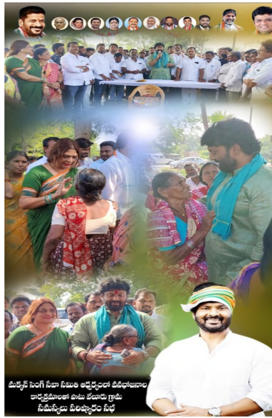
కార్యక్రమంలో.. పాలకుర్తి మండల కాంగ్రెస్ పార్టీ నాయకులు, మాజీ సర్పంచ్ లు, ఎంపీటీసీ లు, వెంసూర్ గ్రామ ప్రజలు, మండల నాయకులు, తదితరులు పాల్గొన్నారు.