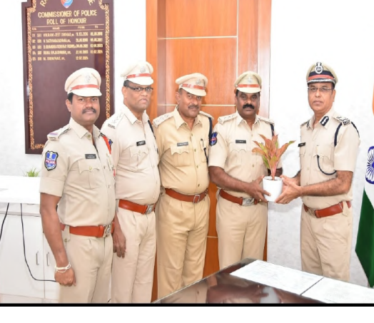
రవీందర్ లు పాల్గొన్నారు.