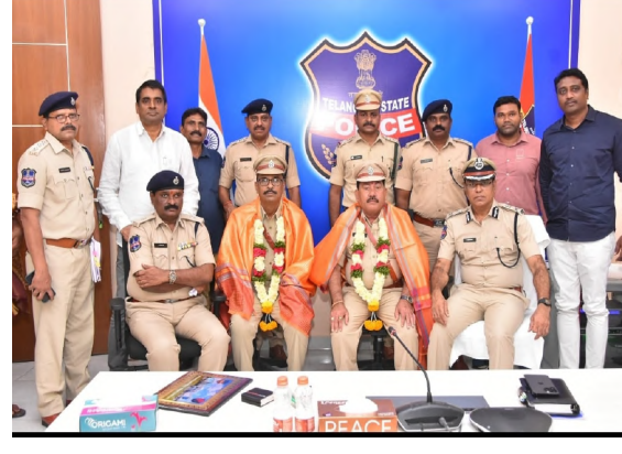
తీసుకోవాలని కోరారు. ఎటువంటి అవసరం ఉన్న కమీషనరేట్ పోలీసు వ్యవస్థ ఎల్లవేళలా అందుబాటులో ఉంటుంది...