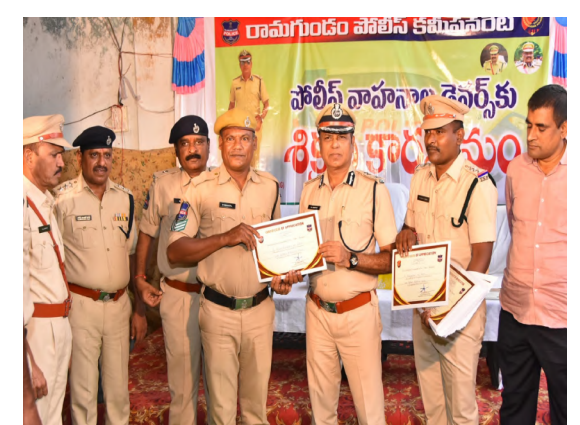
అన్నారు. కాబట్టి ఒక చిన్న నిర్వహణ కారణం వలన ప్రమాదం సంభవించి వారి కుటుంబ భవిష్యత్తు రోడ్డు పాలడం జరుగుతుందన్నారు. వాహనంలో కూర్చొని ప్రయాణించనప్పుడు అలర్ట్ గా వుండి, పరిసరములు నిశితముగా గమనిస్తూ ముందుకు వెళ్ళవలెను. బాండ్ అనందమైన విషయం ఐనా, సంశోకరమైన విషయం ఐనా, బాధ కరమైన లేదా ఎలాంటి సమస్య ఉన్న వాహనం ఎక్కడైతే ఉంచాలి. ఒక్కసారి డ్రైవింగ్ సీట్ లో కూర్చున్నాక పూర్తి స్థాయిలో డ్రైవింగ్ పై ఉండాలి లేకపోతే ఏదో ఆలోచనలో ఉండి వాహనం ప్రమాదానికి గురై అవకాశం ఎక్కువ. వాహనం నడిపేసమయంలో సెల్ ఫోన్ లో మాట్లాడటం, డ్రాఫ్ట్ రాల్స్ అతిక్రమించటం చేయరాదు. వాహనం ని ఇష్టమసారంగా ఆపి, నిర్దష్టంగా కూర్చొని పరిస్థితులు, పరిసరాలు గమనించకుండా, సెల్ ఫోన్ చూడటం లో కాని, పేపర్ చదవడం లో గాని నిమగ్నం కాకూడదు. సీట్ బెల్ట్ తప్పనిసరిగా పెట్టుకోవాలి అదే విధంగా అధికారులకు కూడా తప్పనిసరిగా పెట్టుకోవాలి విధంగా చెప్పాలి. అందరూ డ్రాఫ్ట్ రాల్స్ పాటించాలి. ప్రజలకు పోలీసులు అందరూగా ఉండాలి. డ్రాఫ్ట్ రాల్స్ పాటించకుండా పోలీస్ ప్రతిష్ట కి భంగం కలిగి విధంగా ప్రవర్తన చేసిన వ్యక్తులు తీసుకోవడం జరుగుతుంది అన్నారు. ఏదైనా ఆరోగ్య కుటుంబ సమస్యలు ఉన్నప్పుడు అధికారులకు తెలియ చేయాలి మీ స్థానంలో వేరొక డ్రైవర్ ని పంపడం జరుగుతుంది. చెప్పకుండా డ్రైవింగ్ కష్టపడతూ చేయడం వలన ప్రమాదాలు జరిగి అవకాశం ఉంటుంది. ఈ కార్యక్రమంలో అడిషనల్ డీసీపీ అడ్వీస్ రాజు, స్పెషల్ డ్రాఫ్ట్ ఏసీపీ రామవేంద్ర రావు, డ్రైవింగ్ పోలీస్ రవి కుమార్, పిఆర్ ఏసీపీ సుందర్ రావు, డ్రైవింగ్ పోలీస్ ఇన్స్పెక్టర్ దేవయ్య, ఆర్ఐఎం ఎం.టి.ఓ. సంవత్, ఆర్ఐఎం వాసు మూర్తి, ఆర్ఐఎంబలు పాల్గొన్నారు.