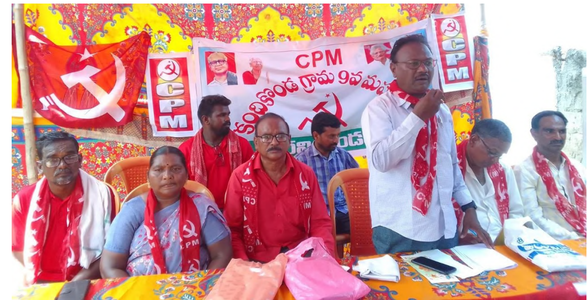
నిర్వహించాలని పిలుపునివ్వడం జరిగిందిని ఆయన తెలిపారు. లోజోలో ఆకు నిత్యపర వస్తువుల ధరలు వివేచితంగా ప్రచారం అలాగే పెట్రోల్, డీజిల్ ధరలను కూడా పెరగడం వల్ల ప్రజలు అనేక ఇబ్బందులు పాలవుతున్నారని, ప్రభుత్వ రంగ సంస్థల ప్రైవేటీకరణ కారణంగా ఉద్యోగాన్ని ఊడిపోతున్నారని ఉపాధి కష్టం మారిన ఈ పరిస్థితుల్లో కేంద్ర బిజెపి విధానాలకు వ్యతిరేకంగా పార్లమెంట్ కు ఉద్ధమాలకు సన్నద్ధం కావాలని ఆయన పిలుపునిచ్చారు. కందికొండ గ్రామ ప్రజలు ఎదుర్కొంటున్న సమస్యలపై తీర్మానాలు చేసి గ్రామ అభివృద్ధి కోసం భవిష్యత్తు పోరాటాలకు మహాసభ నాంది కావాలని ప్రజా పోరాటాలలో ప్రజలు భాగస్వామ్యం కావాలని ఆయన