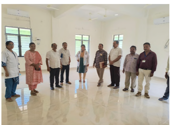
చెప్పారు. తోలుత జిల్లా కలెక్టర్ పరిశీలించిన క్రమంలో త్వరగా ప్రారంభించాలని ఆదేశాలు జారీ చేసిన ఎందుకు నిర్ణయం చేశారని మండల వైద్య అధికారిని మందలించారు. ఇప్పటికే రెండు, మూడు