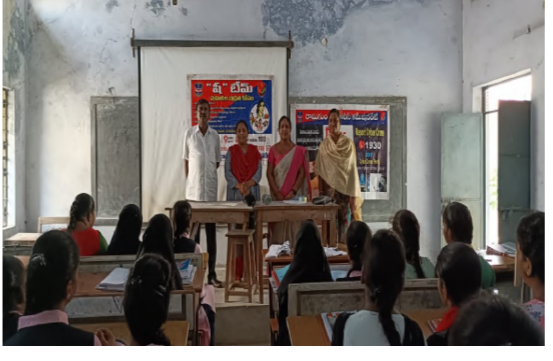
కోరారు. ఫోన్ చేసిన వారి వివరాలు గోపివెట్టి కమిషనరేట్ కు ఎలా జరుగుతుంది స్పష్టం చేశారు. అలాగే అత్యుత్తమ పోయి సైబర్ ట్రైమ్ ఆన్లైన్ మోసాల, లోన్ యాక్సెస్ గుర్తుపట్టారని వాటి జోలికి పోకుండా ఉండాలని, ఎవరైనా ఆన్లైన్ మోసాలకు గురైతే, సైబర్ ట్రైమ్ హెల్ప్ లైన్ నెంబర్ 19303 సమాచారం ఇవ్వాలని, అలాగే మహిళలకు ఏదైనా