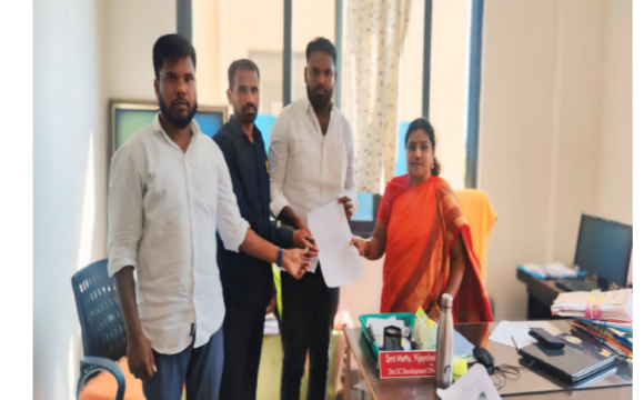
వర్గాల విద్యార్థులను ఉద్యోగాలు సాధించే దిశగా వారిని మోటివేషన్ చేయడానికి, ప్రభుత్వం నుంచి వచ్చే ఈ సదుపాయాలను సద్వినియోగం చేసుకోవడానికి వారికి అర్హమయ్యేలా వాళ్లతో కలిసి పోయి వివరించేందుకు ఆ యొక్క సామాజిక వర్గానికి చెందిన డైరెక్టర్