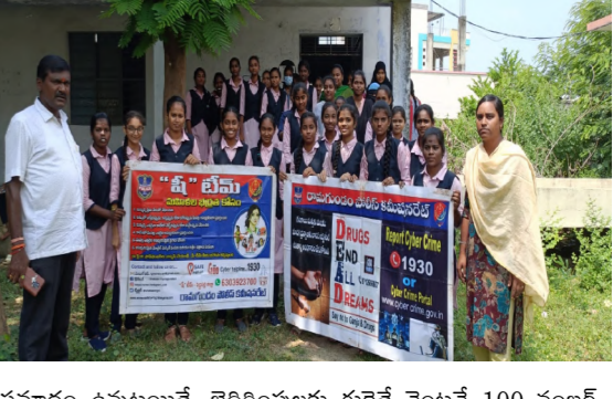
ప్రమాదం ఉన్నట్లయితే, బెదిరింపులకు గురైతే వెంటనే 100 నంబర్ కు డయల్ చేయాలని తెలిపారు. మరియు ఆకాశ్ నుండి ఎలా రక్షణగా ఉండాలని తెలిపారు. ఈ కార్యక్రమంలో షీ టీం నిబ్బంది స్టూడెంట్లు, సోసైటీ మరియు కళాశాల సిబ్బంది, విద్యార్థులు పాల్గొన్నారు.