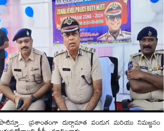
పోలీసు... ప్రశాంతంగా దుర్గామాత పండుగ మరియు నిమజ్జనం జరుపుకోవాలని సీపీ సూచించారు.

భద్రత వహించవలసి. నిమజ్జనం కొరకు ఏ రోజూ ఎక్కడికి ఏ మార్గం ద్వారా తీసుకువెళ్లారు అనే సమాచారం సంబంధిత పోలీస్ స్టేషన్ అధికారులకు ముందుగానే తెలుపండి. పెద్దలు నిర్ణయించిన తేదీ లోపల నిమజ్జనం పూర్తి చేయాలి. మండలం వద్ద కొత్త వ్యక్తులు సంచరించిన వారి యు ఎటువంటి చిన్న సమాచారం ఉన్నా మీ దగ్గరలోని పోలీసులకు తెలుపండి లేదా డయల్ 100 కు ఫోన్ చేసి తెలుపగలరు. దుర్గామాత మండలం వద్ద బ్యాంకేటింగ్ కట్టాలి. రెచ్చగొట్టే పాన్సర్లు, బ్యాంకర్లు, కరవత్రాలను పంచకూడదు. అంటించకూడదు. సోషల్ మీడియాలో వచ్చే అసవసర వదంతలను, పుకార్లు నమ్మకూడదు. దుర్గ మాత విగ్రహాలు ఏర్పాటు చేసిన ప్రాంతాలలో షీ టీం నిబ్బంది మాఫీ లో గమనిస్తూ ఉంటారు. గూకోస్ ప్లెట్ కాన్స్ మరియు నెట్ పెల్టెరింగ్ అధికారులు విగ్రహాలు ఏర్పాటు చేసిన ప్రాంతాలను అధికారులు సందర్శించాలి. ప్రజల సౌకర్యం కొరకు పోలీసు నిఘా, భద్రత ఏర్పాటు చేయడం జరిగింది నిర్వాహకులు మరియు ప్రజలు పోలీస్ వారి సలహాలు సూచనలు