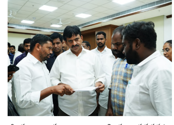
అధికారులు నాలుగు బృందాలు గా విచారణ జరుగుతున్నట్లు విశ్వసనీయ వర్గాల కథనం. ఈ సబ్ రిజిస్ట్రార్ మహబూబాద్ లో సబ్ రిజిస్ట్రార్ గా పనిచేసిన కాలంలో పలు స్వచ్ఛంద సంస్థలకు, పలు సంఘాలకు, పలువరు రాజకీయ నాయకులకు పెద్ద మొత్తంలో చందాలు ఇస్తూ వాటిని పోషించేవాడని బలమైన ఆరోపణలు వినిపిస్తున్నాయి. తన శాఖలోనే ఉన్న ఉన్నతాధికారులు కూడా ఇతని అవినీతిలో భాగస్వాములుగా ఉన్నారని పలు రాజకీయ పార్టీలు కూడా ఆరోపణలు గుప్పిస్తున్నాయి. ఈ రిజిస్ట్రార్ పై పూర్తిస్థాయిలో విచారణ జరిపితే పెద్ద మొత్తంలో ఇతని హయాంలో జరిగిన అవినీతి బయటకు వస్తుందని పలు సంఘాలు తీవ్రంగా ఆరోపిస్తున్నాయి. తన కను సన్నులలో నడిచే వారిని తన దగ్గర ఉంచుకుంటూ అవినీతిగా సంపాదించిన సంపాదనను పలు వ్యాపాలలో పెట్టి నట్లు విశ్వసనీయ సమాచారం. ఏవరిగా డిప్యూటీ ఏమిటంటే తన అవినీతిపై విచారణ బృందాలు విచారణ జరుపుతున్నాయని తెలిసి తన పీకలకు తప్పకుండా అవినీతి ఉన్న చుట్టుకుంటుందని దానికంటే ముందే తాను రాజీనామా చేసే ఉద్దేశంతో ఉన్నట్లు అత్యంత సన్నిహితుల ద్వారా విశ్వసనీయంగా తెలుస్తుంది.

వ్యాసకర్తలు, శ్రీనివాసు నాయక్, నిజం స్టేట్ బ్యూరో తో కలిసి పెనుగొండ రామారావు, "నిజం" జిల్లా స్టాఫర్,