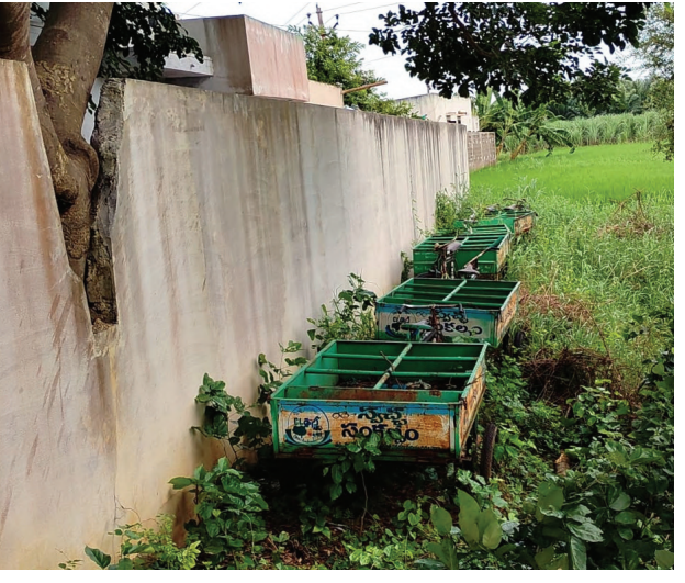
ఏర్పడుతుండో తెలియని పరిస్థితి. ఇప్పటికైనా అధికారులు స్పందించి వాటిని వాడుకలోకి తీసుకురావాలని ప్రజల కోరుతున్నారు.

భాగంలోనివి. చిన్నపాటి సమస్యలకు మరమ్మత్తులు చేపట్టకపోవడంతో లక్షలు ఖరీదు చేసే వాహనాలు వేలాది రూపాయలు విలువచేసే రిక్షాలు ఇలా దుస్థితికి చేరుకున్నాయి. ఫలితంగా గ్రామంలో చెత్త తరలింపునకు ఇబ్బందులు తప్పడం లేదని గ్రామస్థులు పేర్కొంటున్నారు. గ్రామాన్ని చెత్త రహితం చేయాలన్న కల కలగానే మిగిలిపోతోంది, రోడ్లపై చెత్త నిలవలు కనిపించకుండా చేయాలన్న సంకల్పం హామీలకే పరిమిత మౌతోంది.