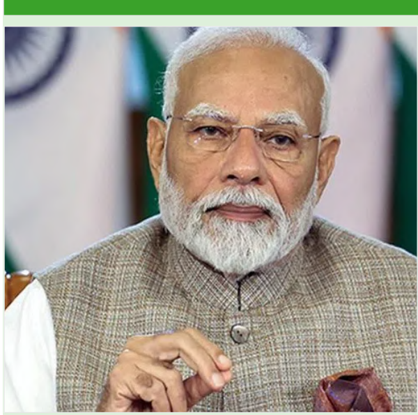
ఇస్లామాబాద్ పర్యటనకు ప్రధాని వెళ్తారా..?

హైదరాబాద్, ఆగస్ట్ 25(( నిజం చెపుతాం న్యూస్ ) SCO ఎ షాంఘై కోఆపరేషన్ ఆర్గనైజేషన్ SCO సమావేశానికి హాజరయ్యేందుకు పాకిస్తాన్ రాజధాని ఆ దేశం ప్రధాని నరేంద్ర మోదీని ఆహ్వానించింది. ఈ ఏడాది ఇస్లామాబాద్ లో సమావేశం జరుగనున్నది. ఈ భేటీకి షాంఘై కో ఆపరేషన్ ఆర్గనైజేషన్ సభ్యదేశాల అధినేతలు భేటీకి హాజరయ్యారు. అయితే, భారత్-పాక్ మధ్య ప్రస్తుత సంబంధాల నేపథ్యంలో ప్రధాని పాక్ కు వెళ్లే అవకాశాలు కనిపించడం లేదు. ప్రధాని ఇస్లామాబాద్ పర్యటకు వెళ్తారా..? ఆయన తరఫున ఎవరైనా మంత్రులను పంపిస్తారా? అనేదానిపై వేచి చూడాలి. ఎస్సీవో సమావేశం ఆక్టోబర్ 15-16 తేదీల మధ్య జరుగనుంది. భేటీకి పాక్ ఆతిథ్యం ఇస్తున్నది. సమావేశానికి ఆతిథ్యం ఇచ్చేందుకు సభ్య దేశాలకు అవకాశం ఉంటుంది. ఇందులో భాగంగా ఈ సారి ఆతిథ్యమిచ్చే బాధ్యత పాక్ కు దక్కింది. ఇంతకు ముందు కజకిస్తాన్ లో జరిగిన సమావేశానికి ప్రధాని దూరంగా ఉన్నారు. సాంకేతిక ఎన్నికల నేపథ్యంలో