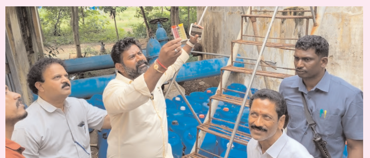
పార్వతీపురం ఆగస్టు 17,(నిజం చెబుతాం ప్రతినిధి) :

పట్టణ ప్రజలకు స్వచ్ఛమైన తాగునీటి అందించేందుకు అధికారులు పూర్తిస్థాయిలో దృష్టి సారించాలని ఎమ్మెల్యే విజయ్ చంద్ర కోరారు. శనివారం ఎమ్మెల్యే బోనెల విజయ్ చంద్ర తోటపల్లి వద్ద నాగాచలి సర్కిల్ని ఇన్ ఫిల్ట్రేషన్ బావులు బూస్టర్ పంప్ షౌన్ తదితర వాటిని పరిశీలించారు.