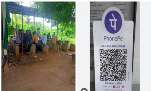
కాకుండా నగదును తీసుకొని మద్యం విక్రయాలు చేపడుతూ బ్యాక్ మనీ దండా చేస్తున్నట్లు పలు ఆరోపణలు ఉన్నాయి. సంబంధిత అధికారులు

కనసనల్లోనే ఈ తతంగం అంతా జరుగుతున్నట్లు సమాచారం. బార్ షాపులకు సిటీంగ్ అనుమతులు అప్పారీ శాఖ కల్పించిన అనుమతితోనే వారు నిర్వహిస్తారు. కానీ బయ్యారం మండలంలోని మూడు వైన్ షాప్ నిర్వహణకు మాత్రం సిటీంగ్ పర్మిట్స్ లేకుండా మద్యం విక్రయాలు చేపట్టడం ఏమిటని పలువురు చర్చించుకుంటున్నారు. అప్పారీ శాఖ నుండి తొందరగా దక్కించుకున్న వైన్ నిర్వహణకు తన ఎకౌంట్ నెంబరు ద్వారానే డిజిటల్ లావాదేవీల ద్వారా కరెంట్ అకౌంట్ తో ఈ తతంగం అంతా చేయవలసి ఉండగా మూడు వైన్ షాప్ నిర్వహణకు సిండ్రికేట్ గా మారి ఒక్కటే బ్యాంకు కరెంట్ అకౌంట్ తీసి మూడు వైన్ షాపుల నిర్వహణకు వారి మద్యం లావాదేవీలను గుట్టు చప్పుడు కాకుండా నడిపిస్తున్నట్లు సమాచారం. మద్యం కొనుగోలుదారులకు వారికి కావాల్సిన మందు వైన్ షాపులో ఉంచకుండా వారు అడిగిన మందు బెట్టే షాపులో దొరుకుతుందని బహిరంగంగానే చెప్పటం శోచనీయం. వైన్ షాప్ నిర్వహణకు తమ షాపుల ముందే బెట్టే షాపులకు అనుమతులు ఏర్పాటు చేయించి వాటిలో అభివృద్ధి శాఖ నుండి వచ్చే మందులు ఎక్కువ రేటుకు అమ్మకాలు చేసి సొమ్ము చేసుకుంటున్నట్లు ఆరోపణలు ఉన్నాయి. దీనితో మద్యం వ్యవసాయకులు బయ్యారం స్టాక్, అఫీసర్ ఛాయిస్, సిగ్నీటర్ ఇతర బ్రాండ్ల మద్యం వైన్ షాపులో దొరక కుండా కనపడకుండా, వారి జేబులు చిల్లు చేస్తూ సిండ్రికేట్ మాఫియా స్థింకే మద్యం ను యదేచ్ఛగా వైన్ షాపులోకి దండ్రి చేస్తున్నట్లు ఆరోపణలు ఉన్నాయి, వైన్ షాపులు బారులు తీసి బెల్టు షాపులకు అమ్మకాలు చేయడం ఏమిటని పలువురు చర్చిస్తున్నారు. దీనిపై సంబంధిత అధికారులకు ఎన్ని సార్లు పిర్యాల చేసినా ప్రయోజనం లేదని పలువురు వాపోతున్నారు. దీనిపై అప్పారీ సిబి విరంజీని ఫోన్ లో వివరణ కోరగా వారు స్పందించలేదు.