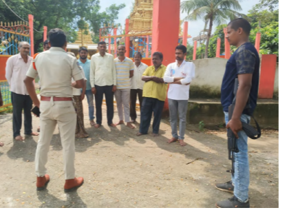
తెచ్చేలా వ్యవహరిస్తున్నారు. ఆహార భద్రత అమల్లో భాగంగా ఉత్పత్తిదారులు లైసెన్సు రిజిస్ట్రేషన్ కలిగి ఉండాలన్నారు. ఎప్పుడైనా నాణ్యత లేని ఆహారం అందిస్తే తమకు ఫిర్యాదు చేయాలని సూచించారు. చాలా లోజులు నిల్వ ఉంచిన, కుళ్ళిపోయిన, చిత్త, రోయిలు చేపలు, లాభ ప్రేక్షతో నిల్వ మాంసాన్ని విక్రయించారన్నారు. తీసుకున్న డబ్బుకు నాణ్యమైన మాంసాహారం భోజనం సరఫరా చేయకుండా కచ్చుర్లీ పడి, నిలువ ఉంచిన కుళ్ళి మాంసాహారం విక్రయిస్తున్నారని ఆరోపణలు వినిపిస్తున్నాయి. అవి నాణ్యత లేకపోవడంతో సరిగ్గా జీర్ణం కావడం లేదు కల్చీ నూనెలు ఆహార పదార్థాలు వాడడమే దానికి కారణమని తెలుస్తుంది. నిలువ మాంసంతో ఆహార పదార్థాల తయారీ దుర్వాసన రాకుండా జాగ్రత్తలు పడతా. డి ప్రీజర్ లో రోజుల తరబడి మాంసం, కల్చీ నూనె మసాలా దినుసులు వాడకం. అలా ప్రమాదకరమని అన్నారు. కనీస నిబంధనలు పాటించని యజమాన్యాలపై చర్యలు తీసుకుంటామని హెచ్చరించారు. ఈ కార్యక్రమంలో పలువురు హెటూల్ యజమాన్యులు తదితరులు పాల్గొన్నారు