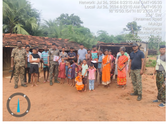
మావోయిస్టుల వారోళ్ళుపై కరపత్రాలను అందించారు. వారోళ్ళుపై లో ఉన్న వ్యక్తుల సమాచారం అందించాలని సమాచారం అందించిన వారికి బహుమతులు అందించడం జరుగుతుందని, సమాచారం ఇచ్చిన వారి వివరాలు గోప్యంగా ఉంచబడుతుందని తెలిపారు. ఈ తనిఖీలలో సివిల్ సిఆర్మీఎఫ్ పోలీసులు తదితరులు పాల్గొన్నారు.