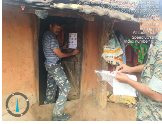
పోలీసులు శతవిధాల ప్రయత్నిస్తున్నారు. దీంతో ఏజెన్సీ గ్రామీణ ప్రాంతాలలో సోదాలు నిర్వహిస్తున్నారు. మావోయిస్టులకు సహకరిస్తున్న వారిపై నిషా ఏర్పాటు చేశారు. అనుమానితులని అదుపులోకి తీసుకొని విచారించి వదిలేస్తున్నారు. మావోయిస్టు లే లక్ష్యంగా భద్రత బలగాలు దృష్టి సారించాయి. ఏజెన్సీ గ్రామీణ ప్రాంతాలు గుత్తి కోయ గూడాలలో

ఏటూరునాగారం జూలై 26 నిజం చెబుతాం న్యూస్ ములుగు జిల్లా బ్యారో:మాచిమూల ఏజెన్సీ అటవీ గ్రామీణ ప్రాంతాలు ఏటూరు నాగారం. సబ్ డివిజన్ పరిధిలో పోలీస్ యంత్రాంగం ములుగు జిల్లా ఎస్సీ శబరిగిడ్ అడవిలో మేరకం, ఏవీసీ ఏటూర్ నాగారం శివమీ ఉపాధ్యాయ సూచనలతో ఏటూర్ నాగారం నిజ అనుముల శ్రీనివాస్, తాజాగిడ్ ల ఆధ్వర్యంలో ముందస్తుగా అప్రమత్తమైపోలీసులు. ఏజెన్సీ సమన్వయంతో ప్రాంతాలపై పోలీసులు దేగ కన్ను తొ ఆదర్శులను జెల్లడ పడుతూ, ఆర్మీఎఫ్ (గ్రీవోండ్స్) బలగాలతో దండకారణ్యంలో పోలీస్ బలగాల మోహించి, మావోయిస్టుల వారోళ్ళువాల నేపథ్యంలో ఏజెన్సీ అడవులను అప్రదిగ్నంధనం చేసిన పోలీసులు. సక్రమిల్లను ప్రతిఘటించేందుకు ఏటూరు మావోయిస్టుల వారోళ్ళుపై నిషాను ఏర్పాటు చేశారు. సరిహద్దు ప్రాంతాలలోని ఆయా గ్రామాలలో ఉన్న లాక్ట్రీలలో ముమ్మరంగా తనిఖీలు చేపడుతున్నారా. రాజకీయ పార్టీల నేతలను ఆగస్టు 3 వరకు బయటకు వెళ్ళుటలూ హెచ్చరిస్తున్నారు. ఆర్టీసీ వారు కూడా రాత్రి వేళల్లో తిరిగి బయటలను రద్దు చేయనున్నారు. మావోయిస్టుల వారోళ్ళువాలను అడ్డుకునేందుకు