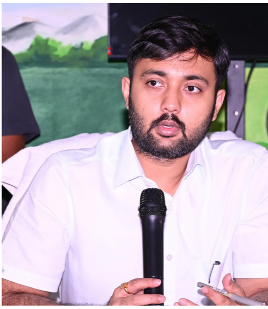
ఆయన అధికారులను ఆదేశించారు, మండలాల పరిధిలో శ్యామ్, మామ్, కేసులను నార్మల్ స్థాయికి తీసుకురావడానికి వారి తల్లిదండ్రులను ఒప్పించి ప్రత్యేక శ్రద్ధ వహించాలని సూచించారు, అనంతరం మండల కేంద్రంలోని గిరిజన బాలికల