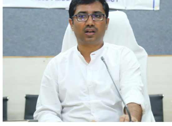
వెనుకంజోలో ఉన్న బ్యాంకుల వారిగా వివరాలు అడిగి తెలుసుకున్నారు. ఏమైనా సాంకేతిక సమస్యలు ఉంటే సంబంధిత అధికారులు, తమ దృష్టికి తీసుకురావాలని కలెక్టర్ బ్యాంకర్లను ఆదేశించారు. మిగిలిన

ఏటూరునాగారం (ములుగు)జూలై 26 నిజం చెబుతాం న్యూస్ ములుగు జిల్లా బ్యారో:నెల్లూరులోగా మొదటి విడత రుణమాఫీ పొందిన రైతులకు రెన్యూవల్ చేసి తిరిగి రుణాలు అందించాలని జిల్లా కలెక్టర్ డి.ఎస్. అధికారులను ఆదేశించారు. శుక్రవారం కలెక్టరేట్ సమావేశం ముదిరిపోతే బ్యాంకర్స్, సంబంధిత అధికారులతో డి సి సి, డి ఎల్ ఆర్ సి సమీక్ష సమావేశం జిల్లా కలెక్టర్ డి.ఎస్. నిర్వహించారు. ఈ సమావేశంలో కలెక్టర్ రుణమాఫీపై బ్యాంకులవారీగా రుణమాఫీ నిధులు విడుదల, వంట రుణాల రెన్యూవల్, పి ఎం ఈ జి పి, పి ఎం ఎఫ్ పిం ఈ, ఎం ఎస్ ఎం ఈ లోన్స్ పై సమీక్షా చేశారు. ఈ సందర్భంగా కలెక్టర్ మాట్లాడుతూ మండల వ్యవసాయ అధికారులు రైతులకు సమాచారం ఇచ్చి బ్యాంకులు దగ్గరకు వెళ్లి రెన్యూవల్ చేసుకునేట్లు చూడాలని అన్నారు. బ్యాంకర్లు వారి పద్ధతు వచ్చే ఫిబ్రవరిలో వివరాలను ప్రతిరోజూ కమిటీకు పంపవలసిందిగా సూచించారు. జిల్లా స్థాయిలో రోజూ వారి ఫిర్యాదుల వివరాలను సమీక్షించవలసిందిగా జిల్లా వ్యవసాయ అధికారిని ఆదేశించారు. రైతు రుణమాఫీ అమలులో