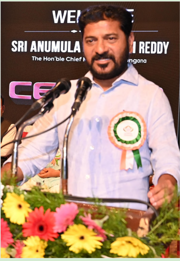
నిరంతరం పర్యవేక్షించేందుకు ఓ వ్యవస్థను ఏర్పాటు చేస్తామన్నారు సీఎం. గత పాలనలో ప్రభుత్వ బడులు వూర్తిగా నిర్లక్ష్యం అయ్యాయని.. విద్యార్థులు లేరనే నేపథ్యంలో బడులను మూసీకారని తెలిపారు. మైవేలు స్కూల్స్ కు పంపిస్తే.. అప్పుల పాలవుతారని చెప్పారు. గ్రామోల్లో స్కూల్స్ పై నిర్లక్ష్యం వహిస్తే.. భవిష్యత్ లో తీవ్ర నష్టం జరుగుతుందని సీఎం రేవంత్ అన్నారు.

● సెమీ రెసిడెన్షియల్ విద్యావిధానంపై సమీక్ష ● టెన్త్లో 10 జిపిఎ సాధించిన విద్యార్థులతో సీఎం రేవంత్ హైదరాబాద్, జూన్ 10 (నిజం చెబుతాం న్యూస్) ప్రభుత్వ పాఠశాలలో సెమీ రెసిడెన్షియల్ విద్యావిధానంపై సమీక్షించి నిర్ణయం తీసుకుంటామని సీఎం రేవంత్ రెడ్డి చెప్పారు. 9వ తేదీ నుంచి ప్రారంభమైన జయశంకర్ బడి బాట కార్యక్రమం.. 20వ తేదీ వరకు కొనసాగు తుందని చెప్పారు. ప్రతి ఒక్కరూ ప్రభుత్వ పాఠశాలలోనే చదవాలని అన్నారు. దేశ ప్రధాన మంత్రి నరేంద్ర మోదీ, టీడీపీ అధినేత చంద్రబాబు, తాను ప్రభుత్వ బడుల్లోనే చదివామన్నారని ముఖ్యమంత్రి రేవంత్ రెడ్డి. పదవ తరగతిలో 10జిపిఎ సాధించిన ప్రభుత్వ పాఠశాల విద్యార్థులతో సీఎం రేవంత్ ఇంటరాక్ట్ అయ్యారు. ఈ సందర్భంగా ఆయన మాట్లాడుతూ.. తల్లిదండ్రుల ఆశయాలను విద్యార్థులు నెరవేర్చాలన్నారు. నారాయణ, చైతన్య స్కూల్స్ లో చదివితే ఫోటో దిగి నా పిల్లలని చెబుతారని.. కానీ, ప్రభుత్వ స్కూల్స్ లో చదివి రాజీప్ నా పిల్లలని చెబుతామన్నారు. 90 శాతం బిఎస్, బిఎస్ఐఐ అధికారులు ప్రభుత్వ బడుల్లో చదువుకున్నవారేనని చెప్పారు. అమ్మ అదర్స్ పాఠశాల నిర్మాణ మహిళా సంఘాలకే ఇచ్చామన్నారు. విద్యకు కేటాయిస్తే నిధుల్లో ఎక్కువ శాతం జీతాలకే అవుతుందన్నారు. విద్యపై చేసేది ఖర్చు కాదని.. అది, పెట్టబడని చెప్పారు. విద్యపై